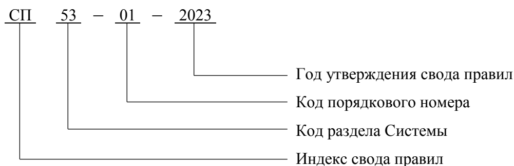
Рисунок 5.1 – Схема формирования обозначения свода правил комплекса «Строительные нормы»

Примечание – До введения в действия настоящего свода правил допускается применение системы обозначения сводов правил, составляющих комплекс «Строительные нормы», в соответствии с ГОСТ Р 1-19.2023.