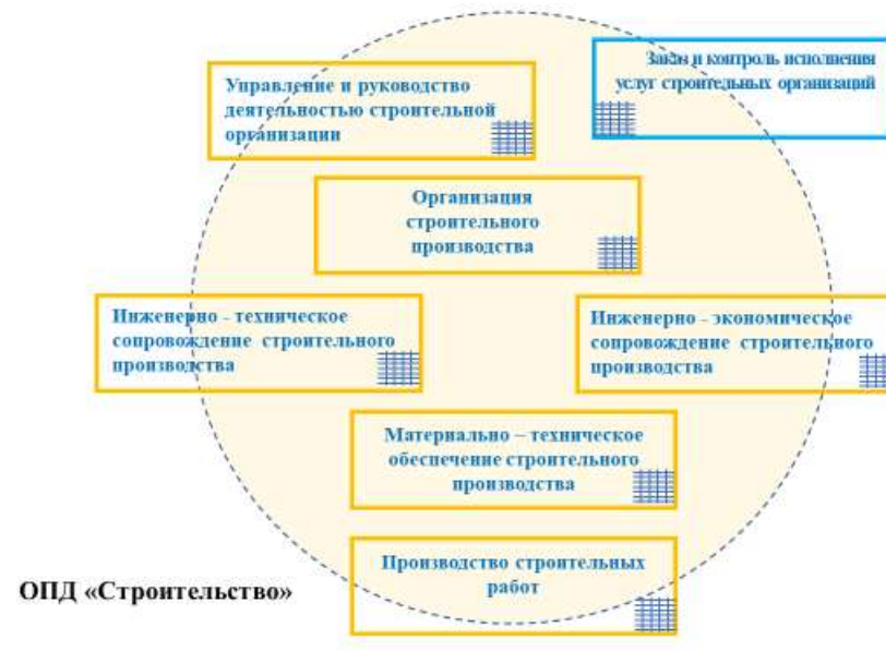
Рис.2. Укрупненная профессиональная структура ОПД «Строительство»

общероссийских классификаторах и справочниках ОКВЭД ОКПД, ОКЗ, ОКПДТР, ЕКСД, отраслевых нормативных и руководящих документах, удается выделить укрупненные производственные (бизнес-) процессы и группировки ВПД, корреспондирующие с указанными процессами, и была сформирована укрупненная структура профессиональной деятельности в ОПД «Строительство» с указанием на позиционно и функционально различающиеся группировки ВПД (см. Рис. 2).